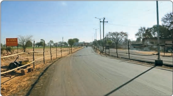
रींगस रोड पार्किंग स्थल से चौमू पुरोहितान तक सड़क निर्माण।