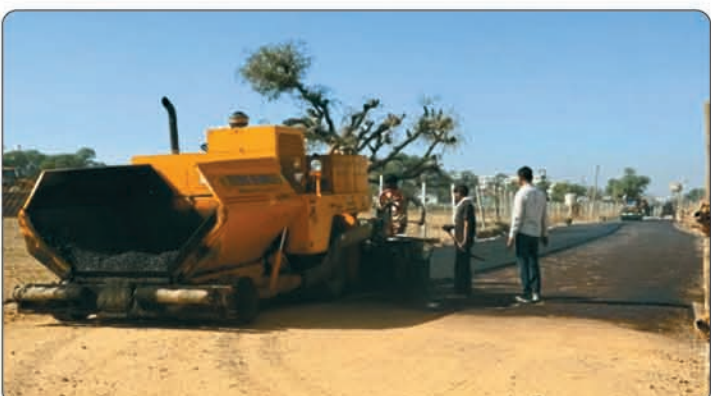
रींगस रोड पर प्रथम चरण में संतोषपुरा से खादूश्यामजी तक पैदलपथ निर्माणाधीन।