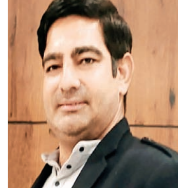
नहीं मिल रहा। काफी विसंगतियां और युटियां हैं, उन्हें सुधारा जाना चाहिए। ओबीसी को