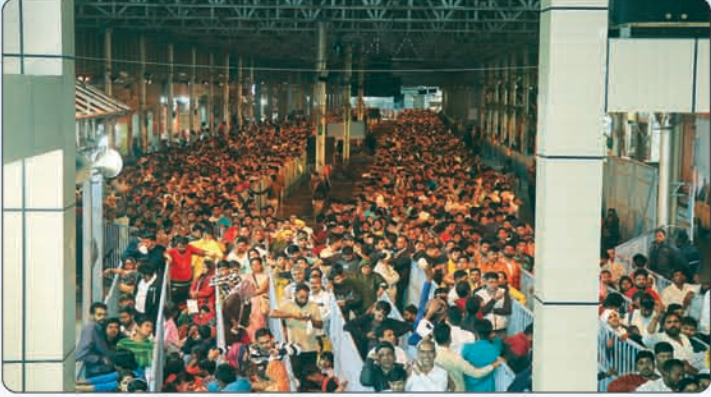
मन्दिर में दर्शन हेतु 14 लाईन बनाई गई।