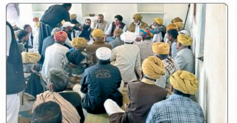
जोधपुर के भंगुरा में घटित घटना में पीड़ितों को आर्थिक सहायता।