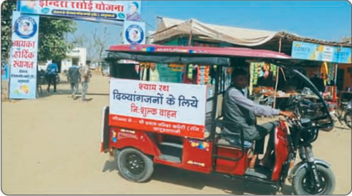
दिव्यांगों के दर्शन हेतु ई-रिक्शा की व्यवस्था।