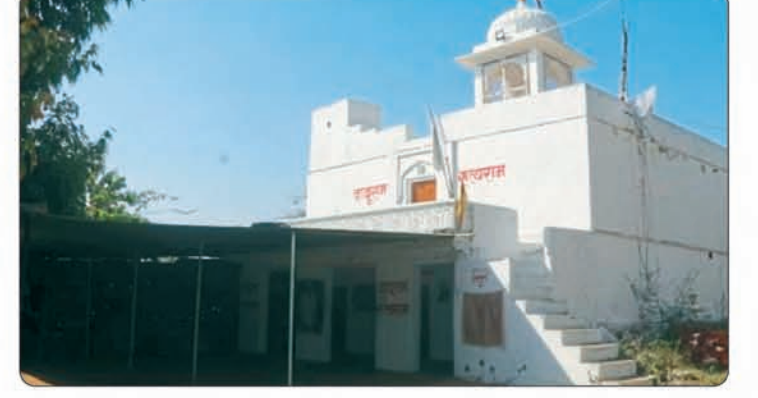
जीर्ण शीर्ण मन्दिरों का जीर्णोद्धार।