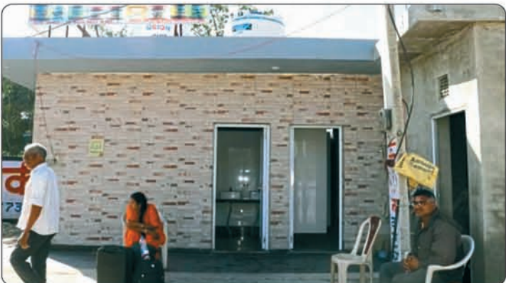
जनसुविधार्थ कस्बे में सुलभ शौचालयों का निर्माण।