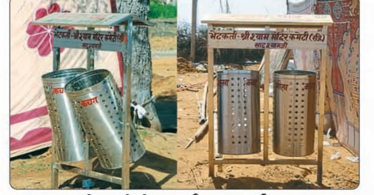
खादूश्यामजी कस्बे में सफाई व्यवस्थार्थ आवश्यकता जनित स्थानों पर स्टील के कचरापात्र स्थापित।