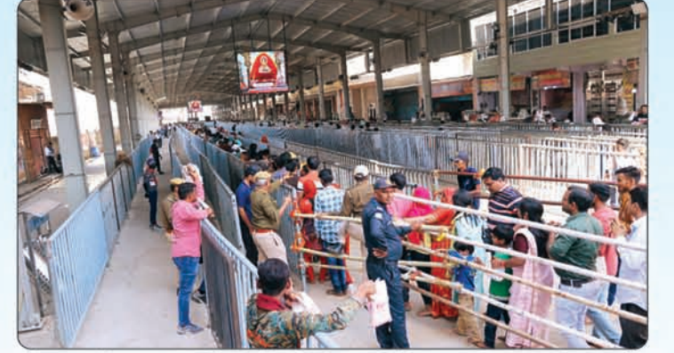
मैदान में 3 एल.ई.डी के माध्यम से श्याम बाबा के दर्शन।