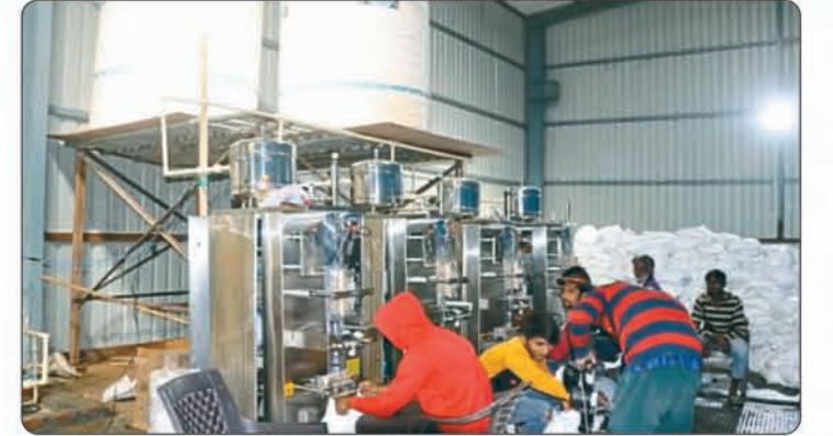
श्याम भक्तों के लिए शुद्ध पेयजल की व्यवस्था