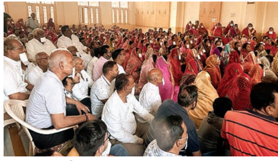
सितारा न्यूज नेटवर्क