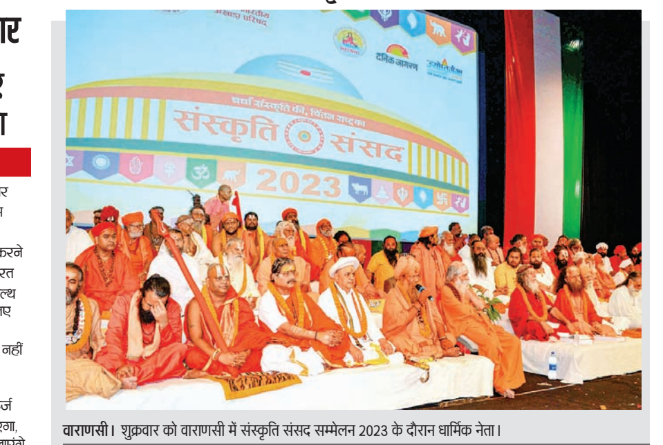
वाराणसी। शुक्रवार को वाराणसी में संस्कृति संसद सम्मेलन 2023 के दौरान धार्मिक नेता।