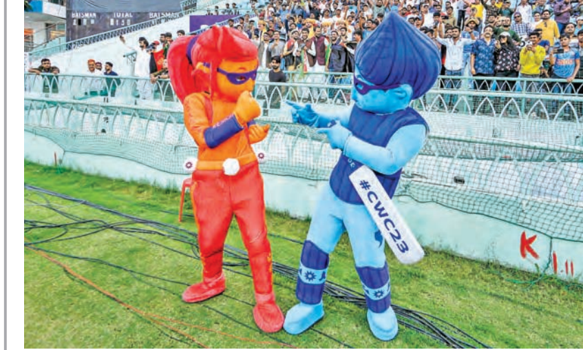
लखनऊ। शुक्रवार को लखनऊ के भारत रत्न श्री अटल बिहारी वाजपेयी पकाना क्रिकेट स्टेडियम में नीदरलैंड और अफगानिस्तान के बीच मैच के दौरान आईसीसी पुरुष क्रिकेट विश्व कप 2023 का शुभंकर।