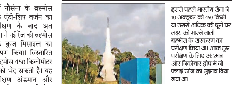
ब्रह्मोस अब तक की सबसे आधुनिक प्रक्षेपास्त्र प्रणाली

इससे पहले भारतीय सेना ने 10 अक्टूबर को 450 किमी. या उससे अधिक की दूरी पर लक्ष्य को मारने वाली ब्रह्मोस के संस्करण का परीक्षण किया था। आज हुए परीक्षण के लिए अंडमान और निकोबार द्वीप में गो-पलाई जंग का सुझाव दिया गया था।