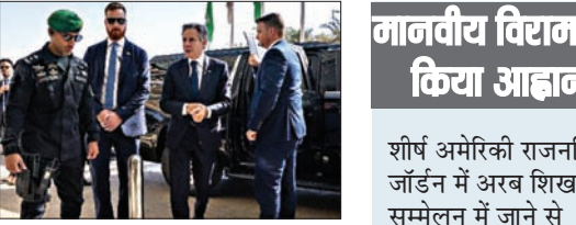
तेल अवीव

नई दिल्ली। अमेरिकी विदेश मंत्री ब्लिंकन तीसरी बार इजराइल पहुंचे हैं। 7 अक्टूबर को हमास ने दक्षिणी इजराइल पर हमला किया था और उसके बाद इजराइल प्रधानमंत्री ने हमास का नामो-निशान मिटाने के इरादे के साथ जवाबी कार्रवाई की है, जिसमें सैकड़ों लोग मारे गए हैं। लिहाजा, गाजा में हमास के खिलाफ युद्ध में नागरिकों को होने वाले नुकसान को कम करने के उपायों पर चर्चा करने के लिए अमेरिकी विदेश सचिव एंटनी ब्लिंकन शुक्रवार को इजराइल पहुंचे हैं।