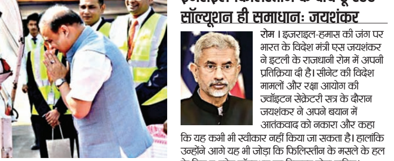
सीमा विवाद अहम

बता दें, पिछले सप्ताह भूटान के विदेश मंत्री टांडी दोरजी ने बीजिंग में चीनी विदेश मंत्री वॉंग यी के साथ बातचीत की थी। भूटान और चीन सीमा विवाद पर भारत की करीब से नजर है। जानकारों की मानें तो नई दिल्ली बीजिंग और शिंघु के बीच जारी बातचीत पर कड़ी नजर रख रहा है।