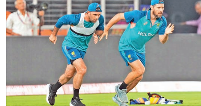
कारण चार हार का सामना करना पड़ा और टीम पिछले तीन मैचों में 170 रन या इससे कम के स्कोर पर आउट हो गयी। इस मैच से पहले दोनों टीम अलग अलग तरह की समस्याओं से जूझ रही हैं। आस्ट्रेलिया को अपने दो अहम खिलाड़ियों मिशेल मार्श और र्लेन मैक्सवेल की अनुपलब्धता के लिए विकल्प ढूढ़ने होंगे।

आस्ट्रेलिया और इंग्लैंड के लिए इस विश्व कप में हालात बिलकुल ही अलग रहे हैं जहां एक टीम विश्व कप तालिका में सेमीफाइनल में पहुंचने के लिए मजबूती से आगे बढ़ रही है तो वहीं दूसरी निचले पायदान पर है। अब शनिवार को एशेज श्रृंखला की दोनों प्रतिद्वंद्वी टीमों आपने सामने होंगी जिसमें उनकी कोशिश एक दूसरे को हराने की होगी। पांच बार की चैंपियन आस्ट्रेलिया ने अपनी बल्लेबाजी को बढ़ावा देकर लगातार चार जीत से अपने खराब अभियान को पटरी पर वापस करायी जिससे वह आठ अंक लेकर तीसरे स्थान पर चल रही है। गत चैंपियन इंग्लैंड को अपने बल्लेबाजों की विफलता के