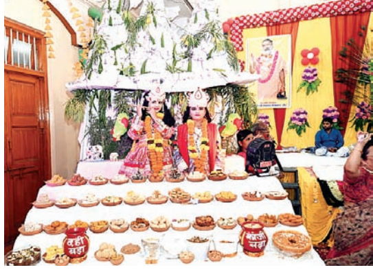
सितारा न्यूज नेटवर्क

कथा में पंचम दिवस हुई गोवर्धन पूजा, सजी छप्पन भोग झाँकी