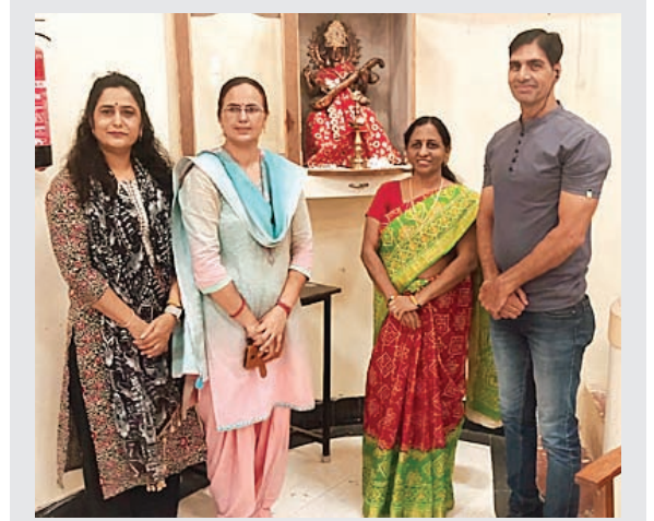
सितारा न्यूज नेटवर्क