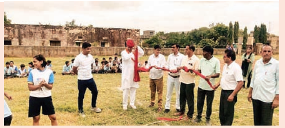
सितारा न्यूज नेटवर्क