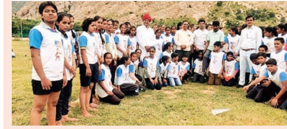
सितारा न्यूज नेटवर्क

ग्रामीणों व स्टाफ सदस्यों ने प्रदेश सचिव पीसीसी-ओबीसी का किया स्वागत