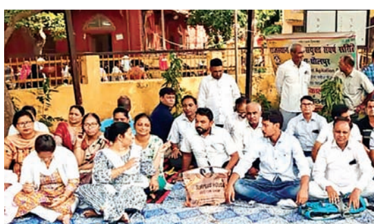
सितारा न्यूज नेटवर्क

नर्सिंग का कार्य बहिष्कार, डॉक्टरों ने संभाली व्यवस्थाएं-राज्य सरकार के खिलाफ नारेबाजी