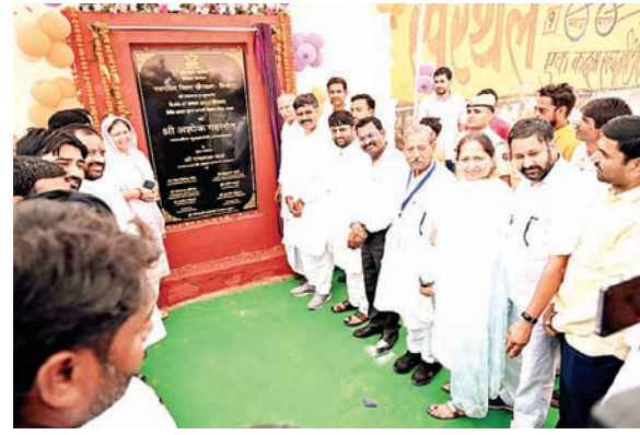
सितारा न्यूज नेटवर्क