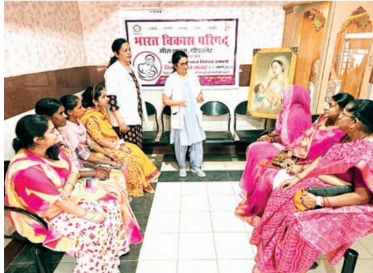
सितारा न्यूज नेटवर्क

गर्भवती महिलाओं को स्तनपान से होने वाले लाभ, जागरूक और स्तनपान के लिए प्रोत्साहित सप्ताह