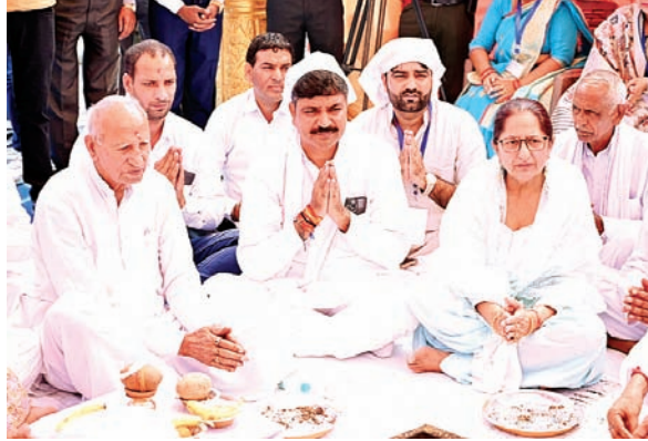
सितारा न्यूज नेटवर्क