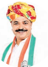
सितारा न्यूज नेटवर्क