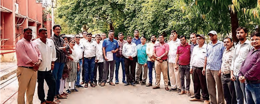
सितारा न्यूज नेटवर्क

धौलपुर/अंकित गोयल। राज्य सरकार पर छलावा करने का आरोप लगाते हुए बुधवार को कर्मचारियों ने अखिल राजस्थान राज्य कर्मचारी संयुक्त महासंघ (एकीकृत) के आह्वान पर जिला कलेक्ट्रेट