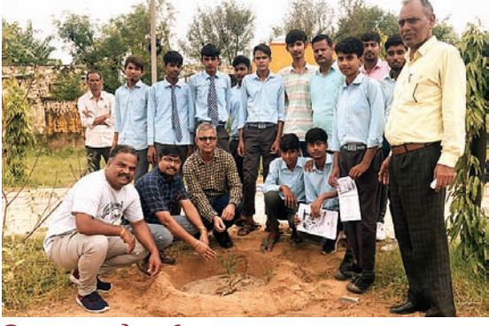
सितारा न्यूज नेटवर्क