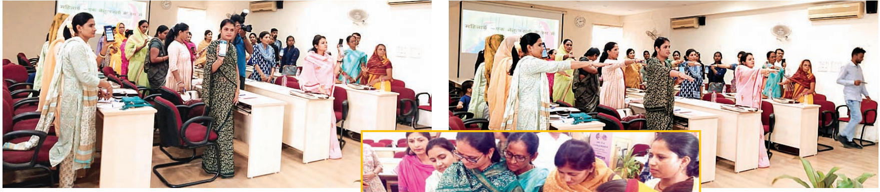
सितारा न्यूज नेटवर्क