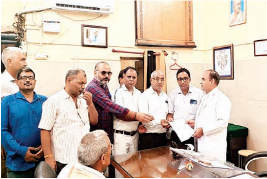
सितारा न्यूज नेटवर्क