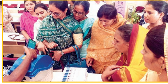
सितारा न्यूज नेटवर्क

की शपथ भी दिलवाई। इस दौरान महिला प्रधान, वार्ड पंच, सरपंच सहित अन्य जनप्रतिनिधियों ने मॉक पोल में भाग लेकर ईवीएम मतदान प्रक्रिया का अनुभव प्राप्त किया। स्वीप को-ऑर्डिनेटर ने इस दौरान सभी जनप्रतिनिधियों को वीएचए एप की जानकारी दी, साथ ही मतदान की शपथ भी दिलवाई।