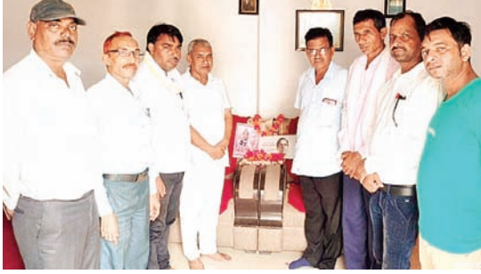
सितारा न्यूज नेटवर्क