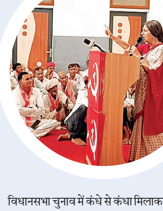
विधानसभा चुनाव में कंधे से कंधा मिलाकर

जनता को राहत प्रदान करने में विफल है वहीं विपक्ष की भूमिका निभा रही भाजपा भी अपनी राजनीतिक रेटियां सेकने में लगी हुई है जनता की समस्याओं से दोनों ही पार्टियों को कोई लेना देना नहीं है। उन्होंने कहा कि आमजन की समस्याओं के लिए संघर्ष करने के लिए केवल माकपा पार्टी ही है जो कि जमीनी स्तर पर पीड़ित जनता के लिए आवाज उठाती है और सरकार को झुकाती है और इसी संघर्ष और काम की बदौलत माकपा प्रदेश में वृंदा करात ने कहा कि प्रदेश में भ्रष्टाचार, पेपर लीक और महिला अत्याचार व बेरोजगारी चरम सीमा पर है और मौजूदा कांग्रेस सरकार