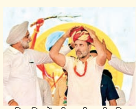
आदिवासियों की जमीन थी। फिर उन्होंने कहा जो आज का मॉडर्न समाज है, उसको आदिवासियों से जिंदगी जीना समझना चाहिए। उन्होंने आगे कहा कि बीजेपी ने 'वनवासी' शब्द दिया, जिसका

राहुल गांधी ने अपने संबोधन में कहा कि एक बार उन्होंने अपनी दादी इंदिरा गांधी से पूछा कि दादी यह 'आदिवासी' शब्द का क्या मतलब है? राहुल गांधी ने कहा, 'जैसे आप जानते हो, वह आदिवासियों से बहुत प्यार करती थीं, मोहब्बत करती थीं। आपसे बहुत गहरा रिश्ता था उनका। इंदिरा गांधी जी ने कहा यह हिंदुस्तान के पहले निवासी हैं। जो हमारी जमीन है जिसको आज हम भारत कहते हैं', यह जमीन इन