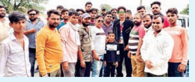
युवाओं को उनके लक्ष्य पर मेहनत करनी चाहिए। निश्चित रूप से सफलता प्राप्त होगी। व युवाओं