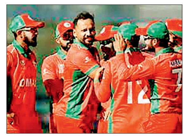
एजेसी नई दिल्ली। विश्व कप क्वालीफायर्स 2023 में आज बुधवार को ओमान क्रिकेट टीम का सामना वेस्टइंडीज क्रिकेट टीम से होगा। यह ओमान का इस टूर्नामेंट में आखिरी मैच है, जिसे जीतकर वह सम्मानक विदाई

चाहेंगे। अपने पिछले 3 मैच लगातार हार चुकी वेस्टइंडीज टीम अब जीत को राह पर लौटने का प्रयास करेगी। बता दें कि कैरेबियाई टीम पहले ही विश्व कप 2023 की दौड़ से बाहर हो चुकी है। अब तक दोनों टीमों में नहीं भिड़ी हैं। यह पहला मौका होगा जब ओमान की टीम वेस्टइंडीज के खिलाफ कोई वनडे खेलेगी।