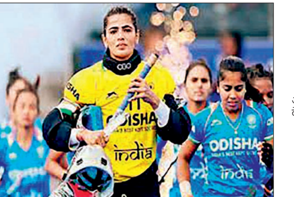
एजेसी नई दिल्ली। हॉकी इंडिया यूरोप दौरे के लिये 20 सदस्यीय राष्ट्रीय महिला टीम का ऐलान किया जिसे जर्मनी में मैच खेलने के बाद 16 जुलाई से स्पेन में चार देशों का टूर्नामेंट खेला जाना है। दोनों टूर्नामेंट सितंबर अक्टूबर में होने वाले हांगझाउ एशियाई खेलों की तैयारी के लिये महत्वपूर्ण हैं।