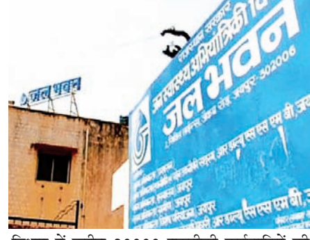
विभाग में करीब 30000 तकनीकी कर्मचारियों की आवश्यकता है। कर्मचारियों की भर्ती नहीं होने से अधिकांश