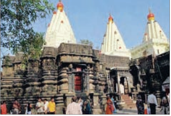
हिंदू देवता अंबा देवी को समर्पित, कोल्हापुर का महालक्ष्मी मंदिर हिंदू आस्था और धर्म के एक महत्वपूर्ण प्रतीक के रूप में खड़ा है। इसका निर्माण 7वीं शताब्दी में चालुक्यों के शासनकाल में हुआ था। इसे देश के शक्तिपीठ मंदिरों में गिना जाता है। महालक्ष्मी हिंदुओं के बीच एक पूजनीय देवी हैं।