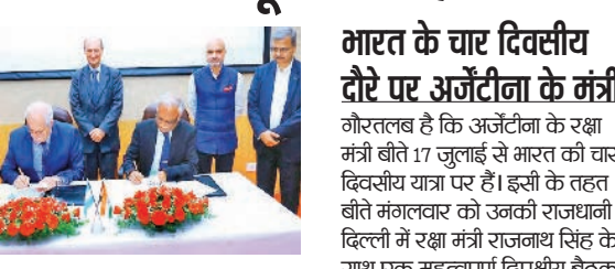
नई दिल्ली