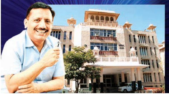
सितारा न्यूज नेटवर्क

दुनिया के कई मुल्कों ने जब बड़े पुरस्कार दे दिए तो फिर घरवाले ही 'मंडल' की हौसला अफजाई क्यों नहीं कर रहे