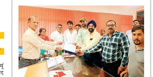
सितारा न्यूज नेटवर्क