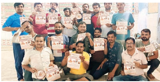
सितारा न्यूज नेटवर्क

श्री अग्रवाल नवयुवक मंडल बाड़ी द्वारा अग्र विराट महाकुंभ यात्रा को लेकर मीटिंग का हुआ आयोजन