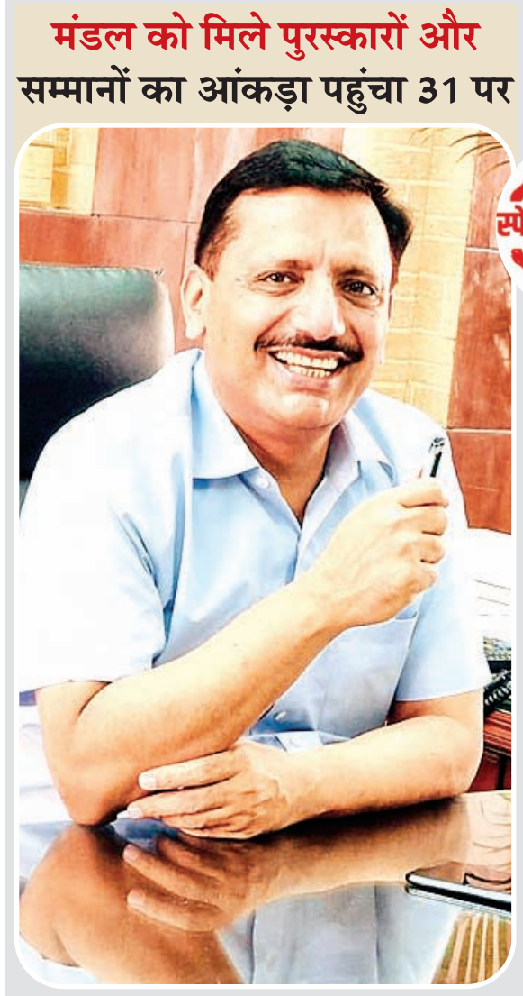
मंडल को मिले पुरस्कारों और सम्मानों का आंकड़ा पहुंचा 31 पर

मुंबई में आवासन आयुक्त को 'एजमप्लरी लीडर ऑफ द ईयर' और मंडल को 'एक्सीलेंस इन पीएसयू' अवार्ड से किया गया