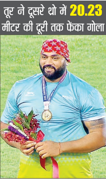
तूर ने दूसरे श्रे में 20.23 मीटर की दूरी तक फेंका गोला

भारतीय गोला फेंक एथलीट तेजिंदरपाल सिंह ने शुक्रवार को यहां एशियाई एथलेटिक्स चैंपियनशिप में अपना स्वर्ण पदक बरकरार रखते हुए महाद्विपीय सर्किट में अपना आधिपत्य स्थापित किया। हालांकि दूसरे श्रे में सर्वश्रेष्ठ प्रयास के बाद वह लंगड़ाते हुए बाहर आए।