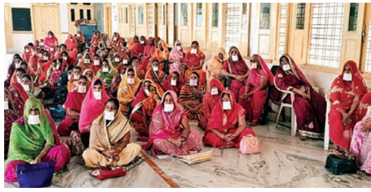
सितारा न्यूज नेटवर्क