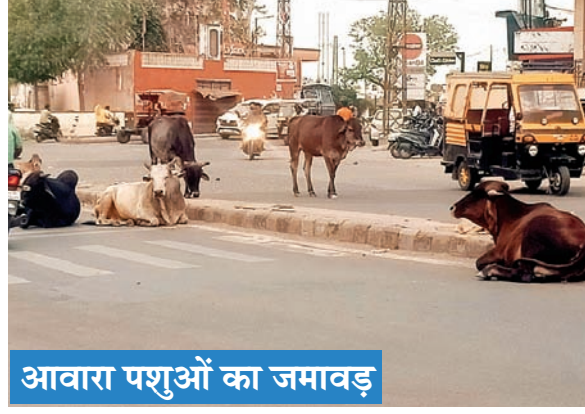
यातायात व्यवस्था तितर-बितर