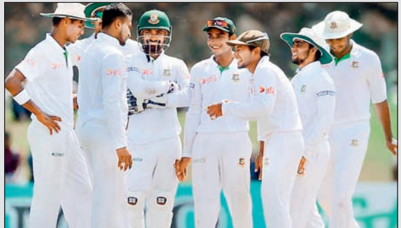
11 टीमों के खिलाफ खेला टेस्ट मैच दरअसल, बांग्लादेश क्रिकेट टीम कुल न्यायर टीमों के खिलाफ टेस्ट

टेस्ट फॉर्मेट को क्रिकेट का असली और सबसे मुश्किल फॉर्मेट माना जाता है। इंग्लैंड और ऑस्ट्रेलिया के बीच क्रिकेट इतिहास का सबसे पहला टेस्ट मैच खेला गया था। इस वक्त आईसीसी टेस्ट रैंकिंग में नंबर-वन पर ऑस्ट्रेलिया, नंबर-2 पर इंडिया और नंबर-3 पर इंग्लैंड की टीम मौजूद है, लेकिन बांग्लादेश क्रिकेट टीम ने टेस्ट फॉर्मेट में एक ऐसा रिकॉर्ड बनाया है, जो दूसरी कोई टेस्ट क्रिकेट टीम नहीं कर पाए है।