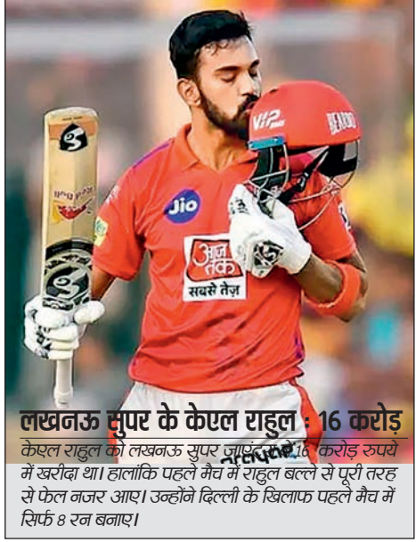
लखनऊ सुपर के केएल राहुल : 16 करोड़ केएल राहुल को लखनऊ सुपर जॉयंट्स ने 16 करोड़ रुपये में खरीदा था। हालांकि पहले मैच में राहुल बल्ले से पूरी तरह से फेल नजर आए। उन्होंने दिल्ली के खिलाफ पहले मैच में सिर्फ 8 रन बनाए।