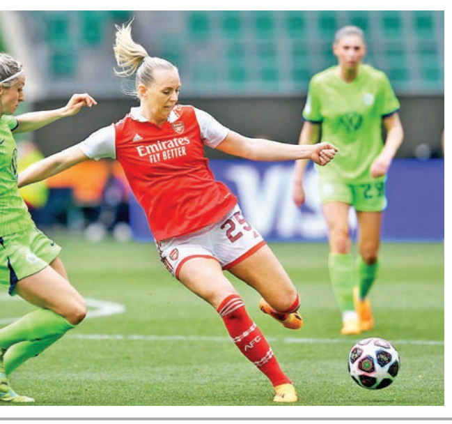
वोल्फ्सबर्ग। जर्मनी के वोल्फ्सबर्ग में वोल्फ्सबर्गन एरिना में दीपकपाल वोल्फ्सबर्ग और आर्सेनल के बीच यूईएफए महिला चैंपियंस लीग सेमी फाइनल के पहले चरण के मैच के दौरान गेंद को कब्जे में लेने के लिए जुझते खिलाड़ी।

अस्ताना। भारत के ग्रैंड मास्टर अर्जुन एरिगोसी ने दो माह बाद इंटरनेशनल शतरंज में धमाकेदार वापसी की है और विश्व के दिग्गज खिलाड़ियों की मौजूदगी में उन्होंने शेट्टी जुल्दी इंटरनेशनल रैपिड शतरंज का खिताब बेहद शांदाद अंदाज में अपने नाम कर लिया है। 12 खिलाड़ियों के बीच राउंड रॉबिन आधार पर 11 राउंड के इस टूर्नामेंट में अर्जुन ने अपराजित रहते हुए 9.5 अंक बनाए और इस दौरान उन्होंने 3 मुकामलों में जीत दर्ज की।