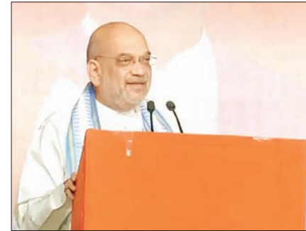
लोगों का ध्यान हटाने के लिए पार्टी का नाम बदला शाह ने कहा- पूरी दुनिया KCR की पार्टी के खिलाफ लोगों को गुस्से को देख रही है। लोगों को डउफ और

हैदराबाद। केन्द्रीय गृह मंत्री अमित शाह ने रविवार को कहा- अगर तेलंगाना में भाजपा को सरकार बनी तो राज्य में मुस्लिम आरक्षण खत्म कर देंगे। पिछले 8-9 सालों से चल रही डउफकी भ्रष्ट सरकार की उल्टी गिनती शुरू हो चुकी है। शाह तेलंगाना के चेवेल्ला में जनसभा को संबोधित कर रहे थे। शाह ने कहा- KCR की पार्टी इफ्र का चुनाव चिह्न कार है। इस कार की स्टीयरिंग मजलिस (ओवैसी) के पास है। अब स्टीयरिंग मजलिस के पास है तो कार की दिशा अच्छी हो सकती है क्या ये भारत का नक्शा भी बनाते हैं तो उसमें कश्मीर आजाद होता है। आजाद कश्मीर बताकर इन्होंने भारत का अपमान किया है।