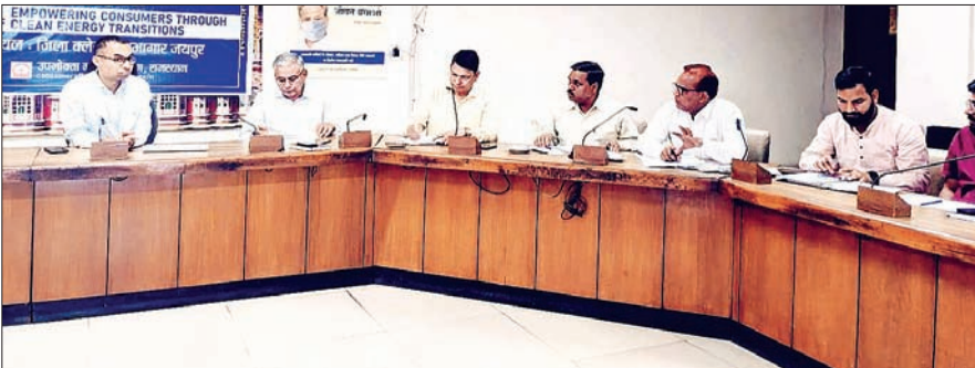
गरीबों का सितारा

कलक्टर सभागार में हुई जिला जल एवं स्वच्छता समिति की बैठक