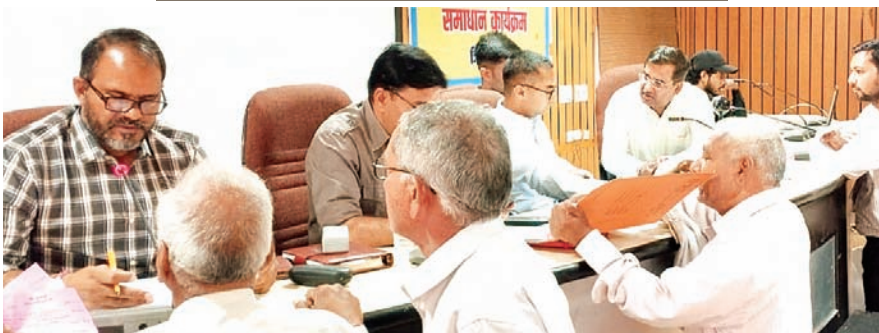
गरीबों का सितारा