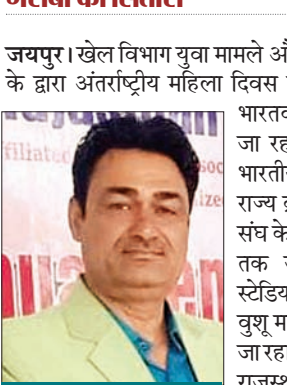
गरीबों का सितारा