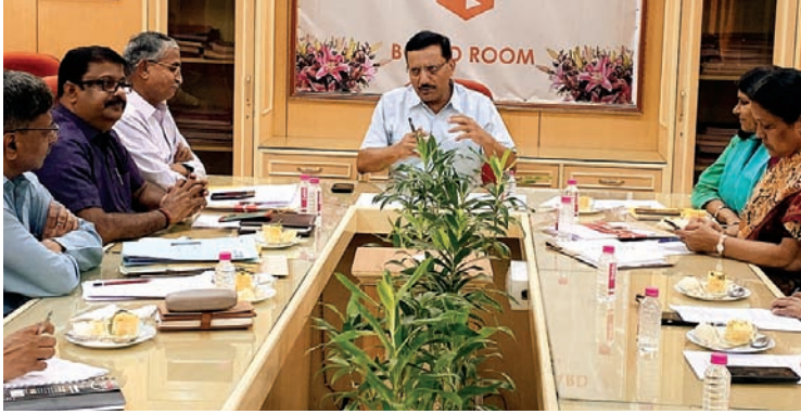
गरीबों का सितारा