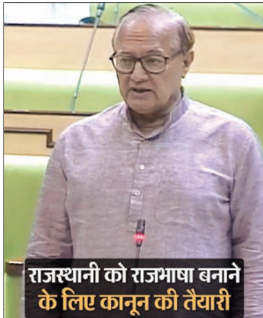
राजस्थानी को राजभाषा बनाने के लिए कानून की तैयारी

जयपुर। राजस्थानी भाषा को राजभाषा का दर्जा दिलाने के लिए सरकार ने प्रक्रिया शुरू कर दी है। दूसरे राज्यों की स्थानीय भाषाओं की तज पर राजस्थानी को भी 7 जल्द राजभाषा बनाने का फैसला होने के आसार हैं। विधानसभा में उपनेता प्रतिपक्ष राजेंद्र राठौड़ ने राजस्थानी को मान्यता और राजभाषा का दर्जा देने का मामला उठाया। शिक्षा मंत्री बीडी कल्ला ने कहा कि राजस्थान में अभी राजस्थान ऑफिशियल लैंग्वेज एक्ट 1956 लागू है। राजस्थानी भाषा को राजभाषा में शामिल करवाने के लिए ऑफिशियल लैंग्वेज एक्ट 1956 में संशोधन करने के लिए मामले का परीक्षण करवाया जा रहा है। भाषा विभाग के मंत्री ने एक कमेटी बनाई है। यह कमेटी बनना राजस्थानी को राजभाषा बनाने की प्रक्रिया की शुरुआत है। उपनेता प्रतिपक्ष राजेंद्र राठौड़ ने कहा- 25 अगस्त 2003 को राजस्थानी भाषा को आठवीं अनुसूची में शामिल करने का सर्वप्रथम प्रस्ताव भेजा गया था। संविधान के आर्टिकल 325 के प्रावधानों के हिसाब से राज्य सरकार राजभाषा घोषित कर सकती है। राजस्थान ऑफिशियल लैंग्वेज एक्ट 1956 बना हुआ है, हम इसमें संशोधन करके राजस्थानी को राजभाषा बना सकते हैं। अगर राजस्थानी राजभाषा बन जाएगी तो आरएएस परीक्षा में भी वैकल्पिक भाषा के तौर पर आ जाएगी और