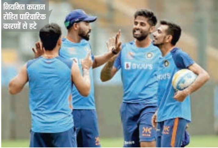
नियमित कप्तान रोहित पारिवारिक कारणों से हटेंगे एकदिवसीय विश्व कप का आयोजन इस साल अक्टूबर-नवंबर में भारत में होगा। भारत ने अपना पिछला विश्वकप घरेलू सरजमीं पर महेंद्र सिंह धोनी के नेतृत्व में 2011 में जीता था। इसे ध्यान में रखते हुए रोहित शर्मा की अगुवाई वाली टीम से भी ऐसी ही सफलता की उम्मीद होगी।

भारतीय टीम तीन मैचों की एकदिवसीय श्रृंखला में शुक्रवार को यहां ऑस्ट्रेलिया के खिलाफ मैदान में उतरेगी तो इस साल के आखिरी में होने वाले विश्व कप की तैयारियों के साथ उसकी नजरें हरफनमौला हार्दिक पंड्या के नेतृत्व कौशल को परखने पर होगी। नियमित कप्तान रोहित शर्मा पारिवारिक प्रतिबद्धता के कारण इस मैच के लिए उपलब्ध नहीं हैं और उनकी गैरमौजूदगी में पंड्या टीम का नेतृत्व करेंगे। पंड्या की कप्तानी में गुजरात जायंट्स ने इंडियन प्रीमियर लीग के अपने पहले सत्र में खिताब जीता था। वह पिछले कुछ समय से टी20 अंतरराष्ट्रीय में भारतीय टीम का नेतृत्व कर रहे हैं। ऑस्ट्रेलिया के खिलाफ चार मैचों की बॉर्डर-गावस्कर श्रृंखला को 2-1 से जीतने के साथ ही जून में आयोजित होने वाले विश्व टेस्ट चैंपियनशिप फाइनल का टिकट पक्का करने के बाद भारतीय टीम अब 50 ओवर के प्रारूप के विश्व कप के लिए अपनी तैयारी को दुरुस्त करना चाहेगी।