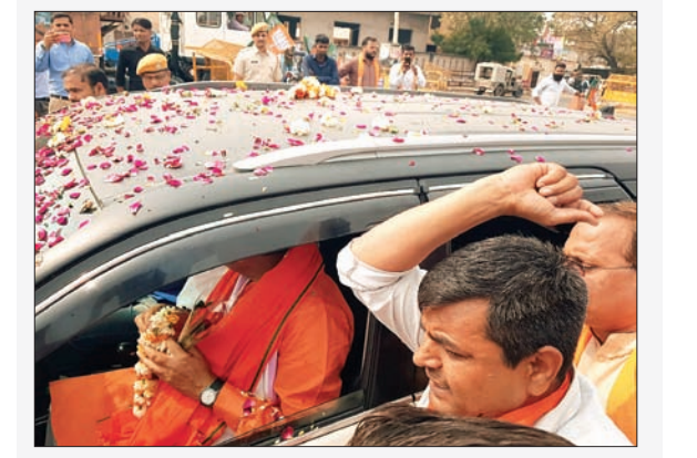
गरीबों का सितारा