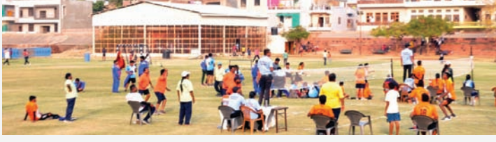
गरीबों का सितारा

जयपुर। द्वितीय सीनियर राष्ट्रीय स्मैश रैकेट प्रतियोगिता में गुरुवार के लीग एवं क्वार्टर फाइनल मैचों के परिणाम निम्न प्रकार रहे। राजस्थान स्मैश रैकेट संघ मोहम्मद इक़राम महासचिव ने बताया कि प्रतिभागियों में मैचों का परिणाम इस प्रकार रहा और सभी टीमों ने लगन एवं ईमानदारी का परिचय देते हुए अपने परिणाम प्राप्त किये। लीग मैच- उत्तरप्रदेश