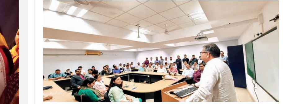
गरीबों का सितारा

जयपुर (विनोद धायल)। जवाहरलाल नेहरू विश्वविद्यालय, नई दिल्ली में आयोजित राजस्थान प्रबुद्ध वर्ग मिलन समारोह में मुख्य