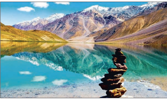
चंद्रताल झील समुद्र तल से लगभग 4,300 मीटर की ऊंचाई पर स्थित हिमाचल प्रदेश की एक प्रसिद्ध झील है जिसकी विनती भारत की सबसे खूबसूरत झीलों में भी की जाती है। यह खूबसूरत झील भारत के दो सबसे अधिक ऊंचाई वाले आर्द्रमण्डलों में से एक है।