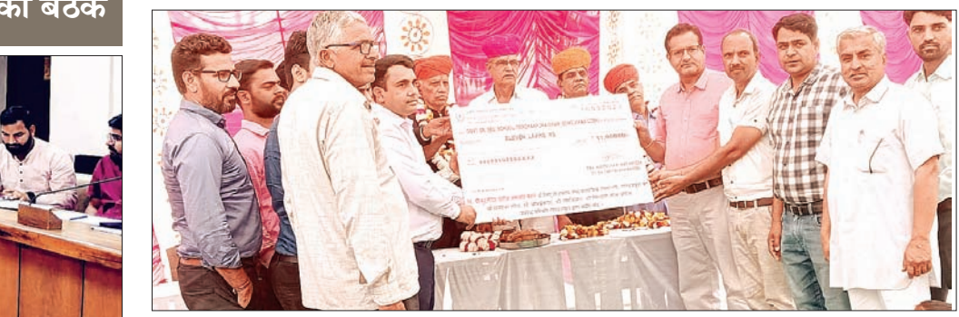
गरीबों का सितारा