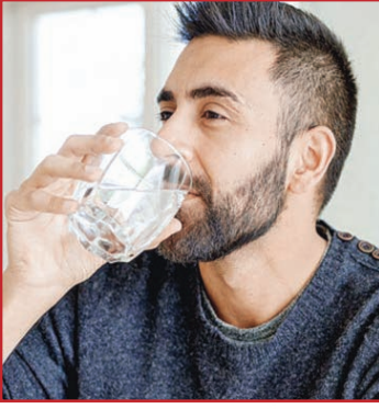
6-8 ग्लास पानी पिएं। इसमें मिल्क, सॉफ्ट ड्रिंक, चाय और कॉफी भी शामिल हैं।

हम अक्सर हेल्थ मैग्जीन, वेबसाइट्स में पढ़ते या लोगों से सुनते हैं कि खूब पानी पीना हेल्थ के लिए अच्छा होता है। लेकिन अति सर्वत्र वर्ज्यत... यह बात जरूरत से ज्यादा पानी पीने पर भी लागू होती है। यहां तक कि ज्यादा पानी पीने से मौत भी हो सकती है।