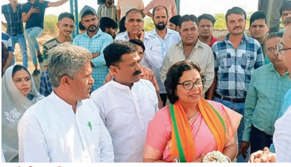
गरीबों का सितारा